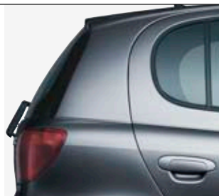
Black Mica (209)*.