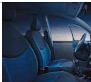
Yaris Limited Edition med lackfärgen Black Mica (209)* har svart klädsel med röda inslag.