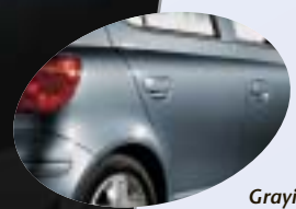
Grayish Blue Metallic 8S5