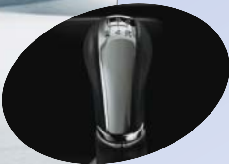
Växelspaksknopp i läder och krom.