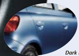
Dark Blue Mica Metallic 8P4