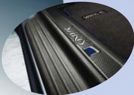
Instegslistor med Yaris Blue logotype.