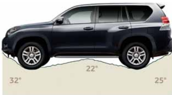
Rampvinkel mellan hjulparen 22° Frigångsvinkel fram 32° Frigångsvinkel bak 25°