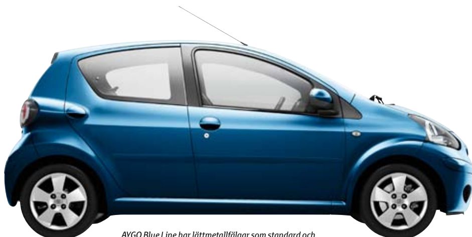
AYGO Blue Line har lättmetallfälgar som standard och känns även igen på sin blå lackfärg 8U7.

Utsläpp av koldioxid för "Medelbilen" i Sverige för första halvåret 2008 var 174 g/km E (källa: Vägverket). Deklarationen följer Konsumentverkets förslag och underlättar för dig att göra ett energieffektivt val.