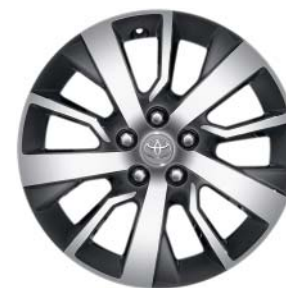
Fälgar 17 tum, lättmetall maskinbearbetade (5-dubbelekrade) Standard på Professional