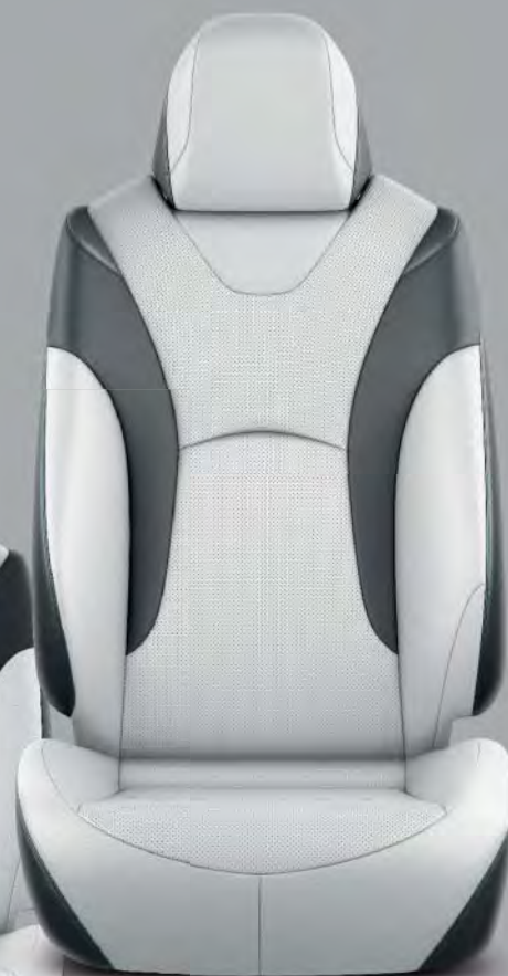
Skinnklädsel, grå med svarta detaljer (LA10) Tillval på Executive