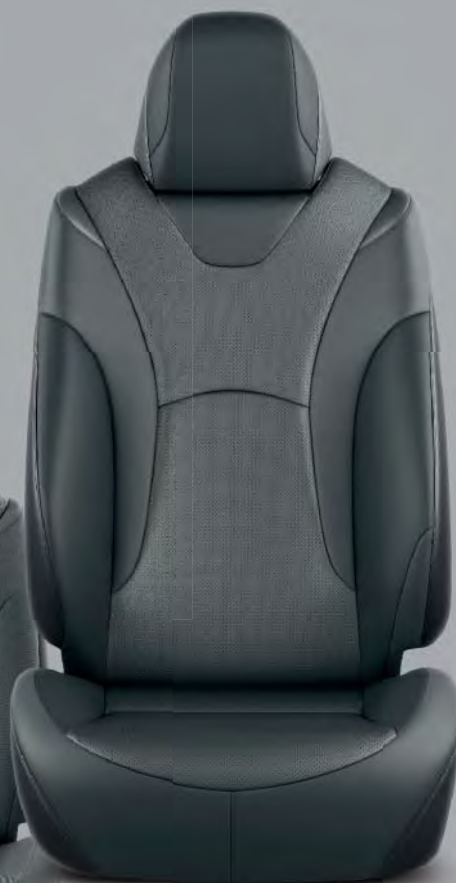
Skinnklädsel, svart (LA20) Tillval på Executive