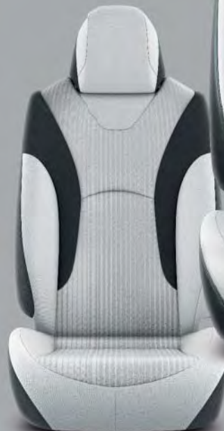
Tyglädsel, grå med svarta detaljer (FA10) Standard på Active, Executive, Solar Pack