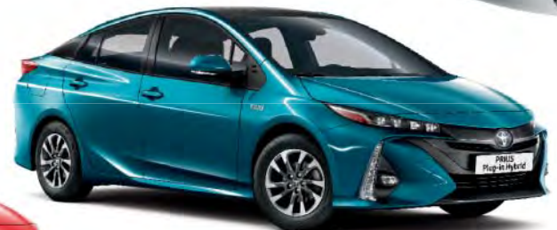
791 Spirited Aqua §