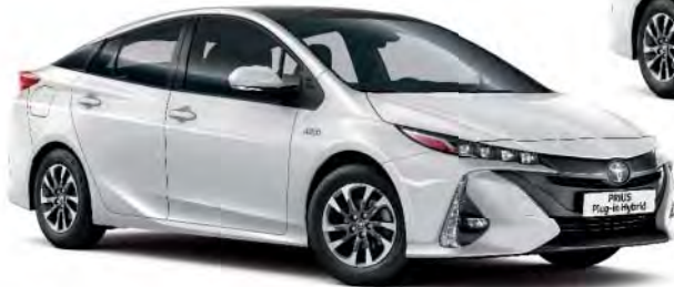
040 Super White