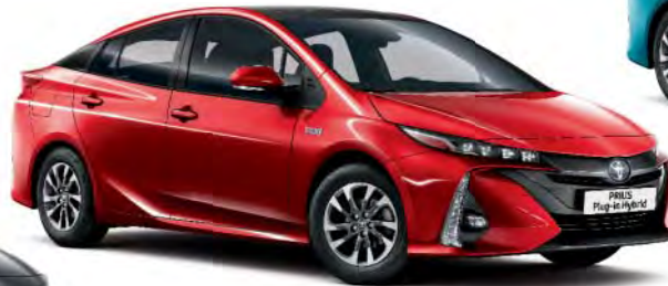
3T7 Emotional Red*