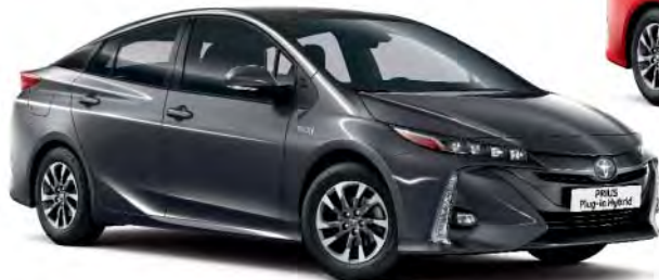
1G3 Grey Metallic §