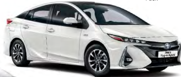
070 White Pearl*