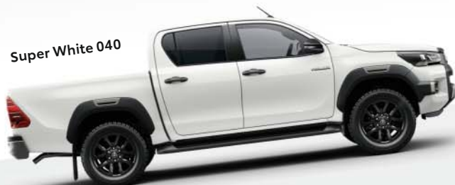
Super White 040