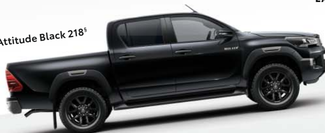
Attitude Black 218 s