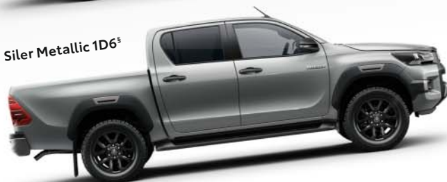
Siler Metallic 1D6 s