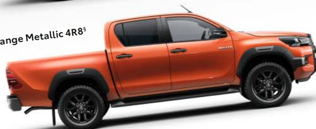
Orange Metallic 4R8 s