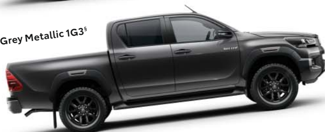
Grey Metallic 1G3 s