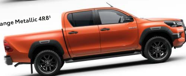
Orange Metallic 4R8 §