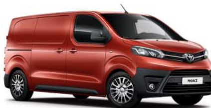
KHK Orange Tourmaline*