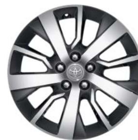
Fälgar 17 tum, lättmetall maskinbearbetade (5-dubbelekrade) Standard på Professional