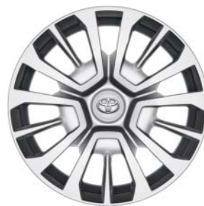
Fälgar 16 tum, stål med hjulsidor Standard på Comfort