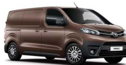
KCM Brown Rich Oak*