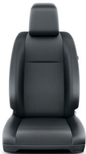
Tyg, mörkgrått med vinylinlägg (OVFX) Standard på Comfort, Professional