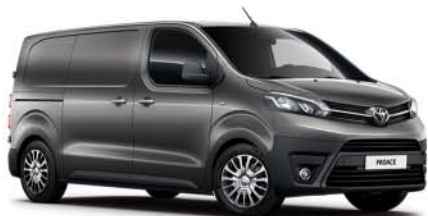
EVL Dark Grey*