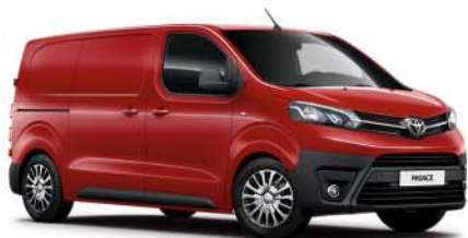
KJF Red §