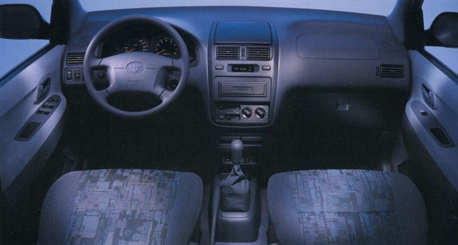
Mugghållare fram och bak