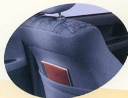
Förvaringsfack bak i båda främre ryggstöden