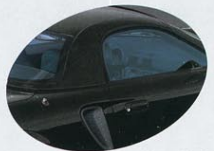
202 Astral Black Svart/Grå eller Svart/Röd interiör

För färgkombinationer gällande klädslar/lacker, ta kontakt med närmaste Toyota återförsäljare.