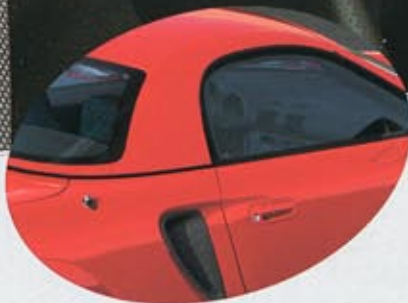
3P0 Fire Red Svart/Grå eller Svart/Röd interiör