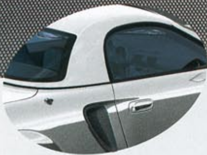
1D0 Absolute Silver Svart/Grå eller Svart/Röd interiör