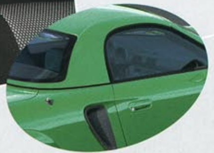
651 Vibrant Green Svart/Grå interiör