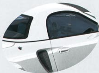
040 Pure White Svart/Grå eller Svart/Röd interiör