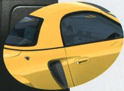
576 Solar Yellow Svart/Grå interiör

Radio och CD-spelare är extrautrustning.