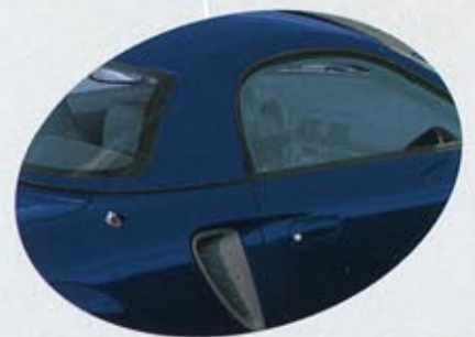
8M6 Reflective Blue Svart/Grå interiör