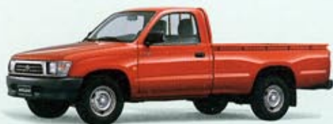
Hilux S-Cab 2WD