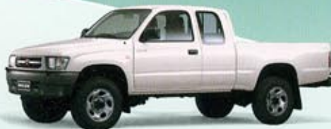
Hilux X-Cab 4WD