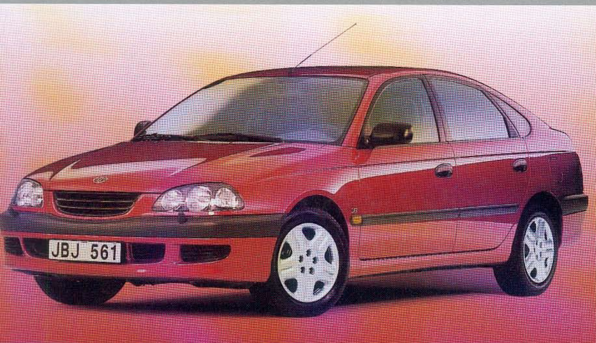
Bilden visar 1.8 Linea Terra