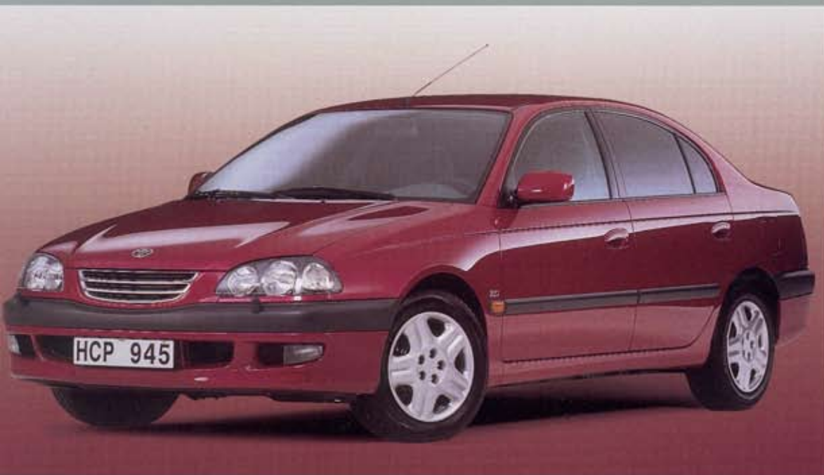
Bilden visar 2.0 Linea Sol