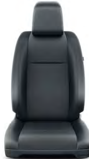
Black PVC (OVFX) Standard på ComfortPlus, Professional