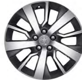
17" lättmetallfälgar (5-ekrade) Standard på Professional