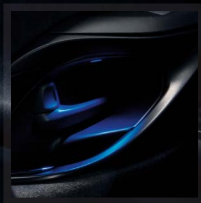
Ambient lighting (tillval)

När du sitter bakom ratten kommer du snabbt märka hur stor skillnad de små subtila ändringarna gjort. När du sätter dig i stolarna kommer du känna en perfekt kombination av komfort och sammansättning, som ger en känsla av överblick och full kontroll.