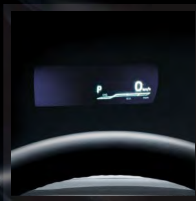
10" Head-up Display (tillval)